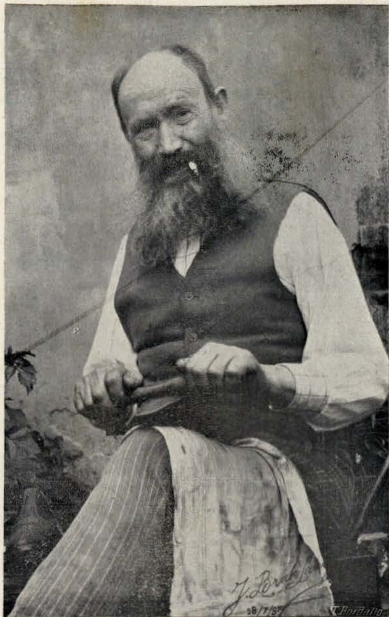
Estudo — J. Brak Lamy — Thomar