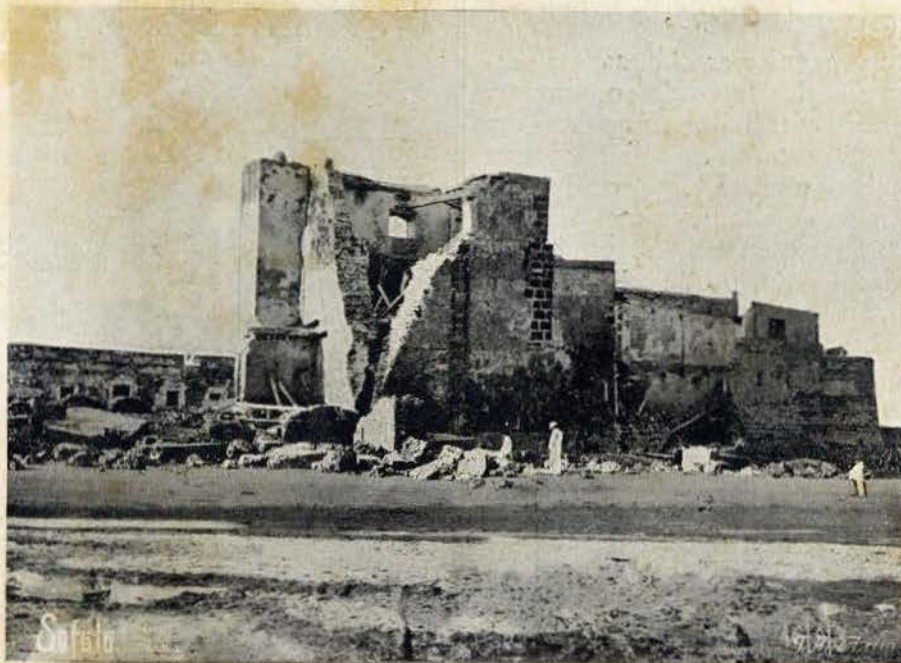
Ruínas da fortaleza de S. Caetano em Sojalla, construída em 1505 por Pedro Pnhaia